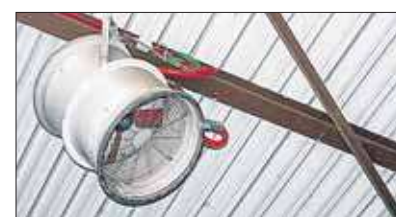
Mit Nebelkanonen wird trockenes Material befeuchtet, damit sich keine Stäube bilden.

Seit 1983 wird die Deponie in Groß Weeden betrieben. Bis auf einen Zwischenfall, als nicht entladene Kfz-Batterien der Bundeswehr „schmurgelten“ und die Feuerwehr zum Löschen kommen musste, blieb die Anlage von Unglücken verschont. Dennoch besteht nach wie vor Angst und Unsicherheit in der Bevölkerung der umliegenden Dörfer. „Als wir uns vor zwei Jah-