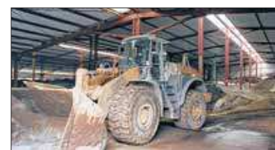
Die Fahrer der Radlader und anderer Fahrzeuge sind in abgeschlossenen Kabinen geschützt.