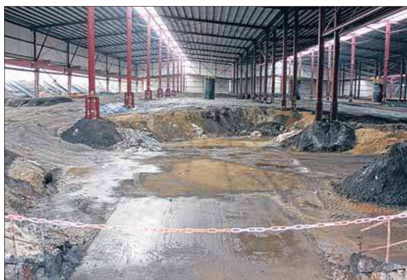
Polder 1a ist weitgehend leer. Gelagert wird hier Sondermüll wie ver-seuchte Böden, Filterstäube oder Schlacken. Brennbares, flüssiges oder biologisch abbaubares Material wird hier nicht angenommen.

Platz auf der Deponie ist noch vorhanden. Drei von insgesamt sieben Poldern sind bereits verfüllt und auch schon rekultiviert. Die