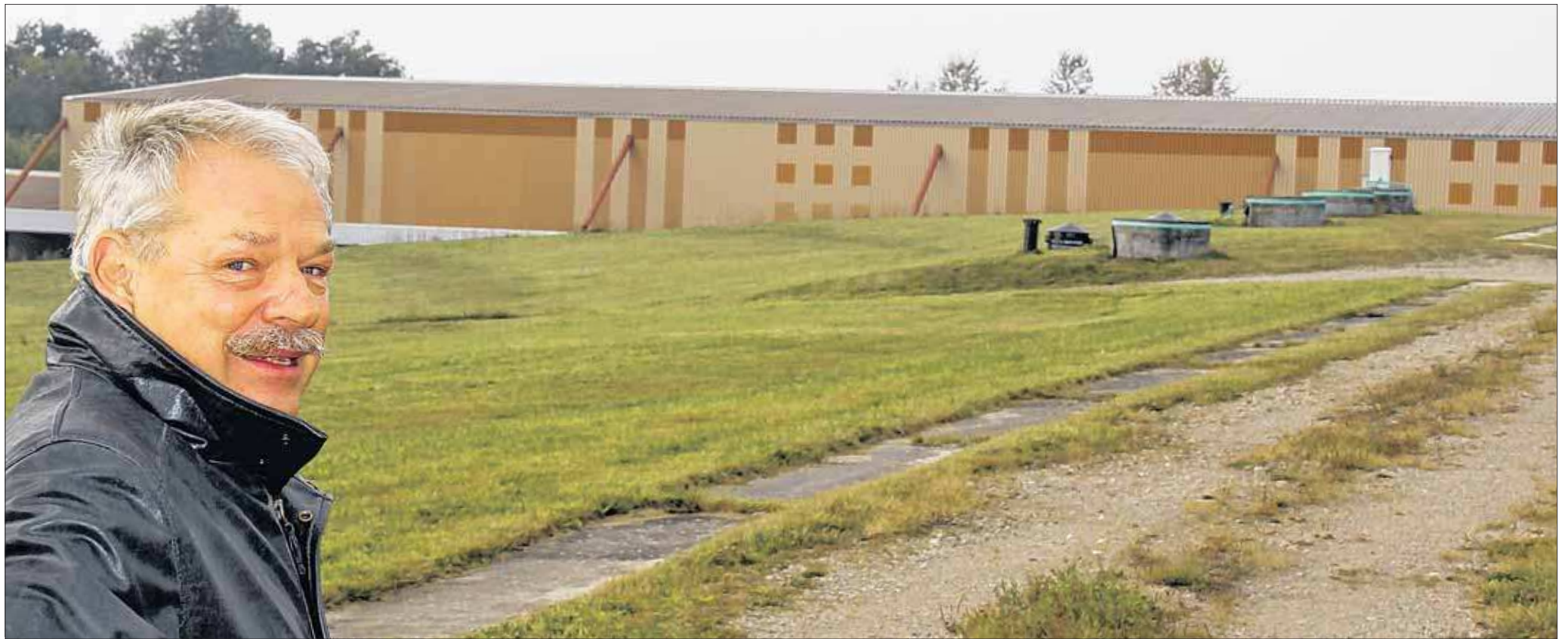
Der Chef der Rondeshagener Sondermüllkippe Hans-Joachim Berner auf bereits rekultivierten Poldern. Jeder Polder ist mit vier Kontrollschichten versehen, in denen regelmäßig mindestens einmal im Jahr überprüft wird, ob die Drainage funktioniert. Im Hintergrund der „eingehauste“ Polder 1a. Die 960 000 Kubikmeter fassende Deponie ist zu 80 Prozent verfüllt.

Es wird wieder milder, heute bleibt es wohl auch noch überwiegend trocken. HÖCHSTTEMPERATUR: 13° TIEFSTTEMPERATUR: 8° WIND: schwach aus Süd.